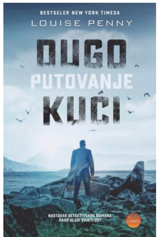
Dugo putovanje kući, Louise Penny

'Dugo putovanje kući', u izdanju Lumena, nakon popularnog bestslera 'Kako ulazi svjetlost' drugi je prevedeni roman autorice Louise Penny u Hrvatskoj.